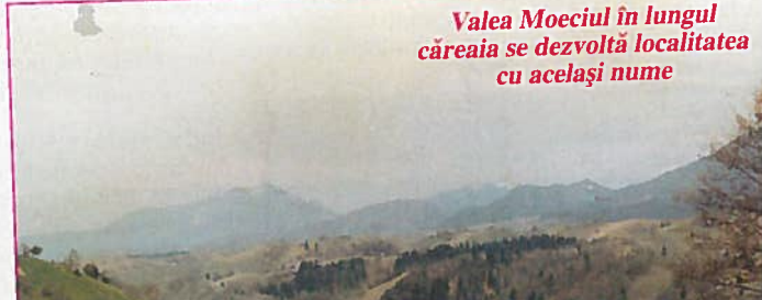
Valea Moeciul în lungul căreia se dezvoltă localitatea cu același nume