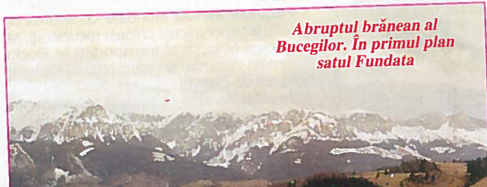
Abruptul brănean al Bucegilor. În primul plan satul Fundata