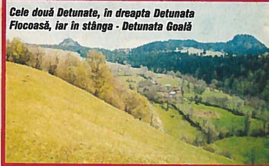
Cele două Detunate, în dreapta Detunata Flocoasă, iar în stânga - Detunata Goală