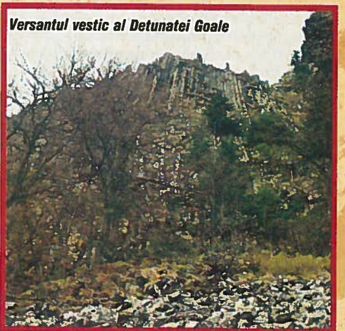
Versantul vestic al Detunatei Goale