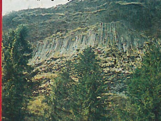
Detunata Goală - coloanele de bazalt seamănă cu „o orgă de piatră”